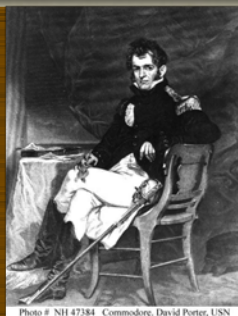
Officiers de la marine US